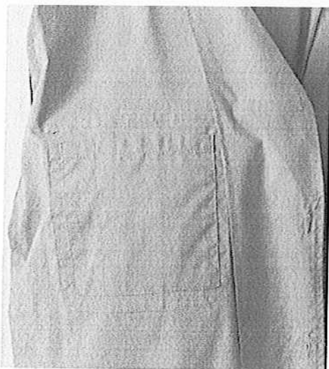
Снимка 3 – Вътрешен джоб на яке с дълъг ръкав