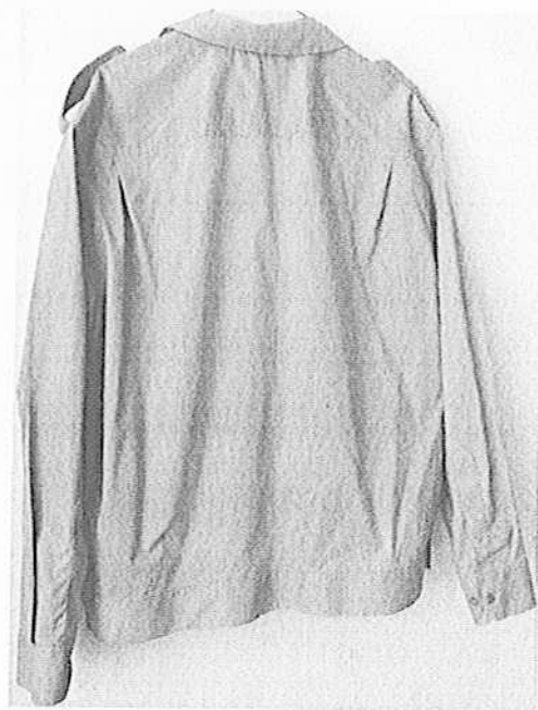
Снимка 2 – Яке с дълъг ръкав, гръб