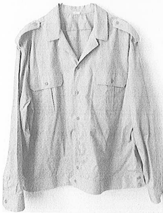
Снимка 1 – Яке с дълъг ръкав, предна част

В долния край на страничните шевове са изработени цепки, които се притварят в две позиции чрез двойка илици на колана на предните части и с по две двойки копчета в двата края на колана на гърба.